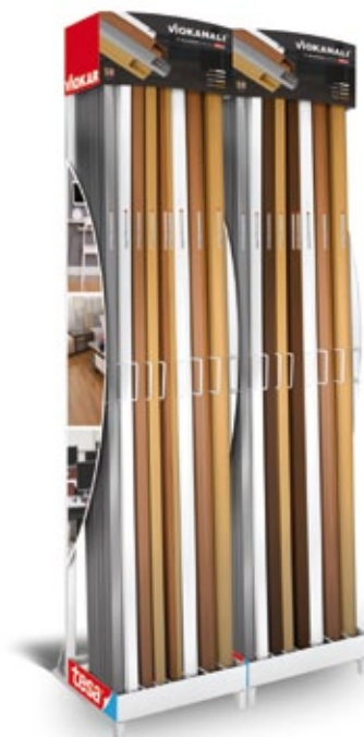
Sales Point για το αυτοκόλλητο VioKANALI