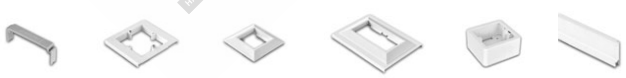
ΤΑΥ / Αντάπτορας διακλάδωσης

* Διακλάδωση με Viokanali 25x25 / 40x40 για τοποθέτηση μηχανισμών σε συνδυασμό με το εξωτερικό κουτί